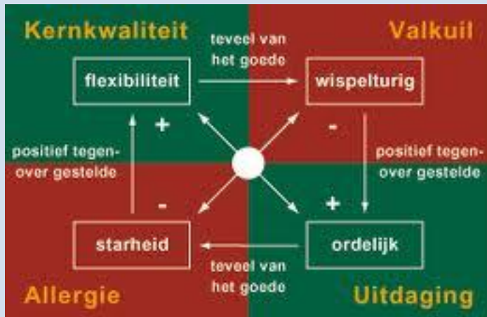
Figuur 2. De Kernkwadranten van Ofman

Terug naar vertrouwen. Vertrouwen kan je niet afdwingen, je moet het verdienen. Door als leider consequent gedrag te vertonen, in lijn met doelen, principes en waarden. Het werkt van 'binnen naar buiten'. We noemen dit ook wel het 'inside-out' paradigma; dat wil zeggen dat organisatiesucces door teamwork de resultante is van alignment in de organisatie, welke voortvloeit uit empowerment binnen de organisatie, wat uitsluitend mogelijk is in een omgeving waarin wederzijds vertrouwen aanwezig is.