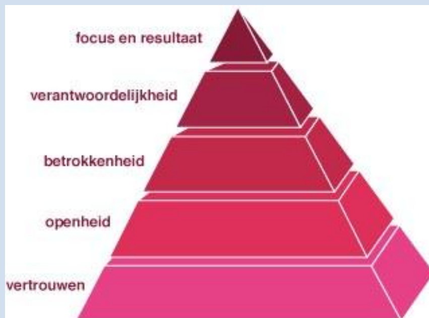
Figuur 1. De piramide van Lencioni

Lencioni beschrijft in zijn model vijf fundamenteën die nodig zijn om succesvol te zijn als een team. We geven een stap-voor-stap omschrijving van de piramide. Voor elk van de vijf stadia geven we aan wat de gewenste uitkomsten zouden moeten zijn en we geven een aantal instrumenten en praktische tips om ook met het eigen team mee aan de slag te kunnen gaan.